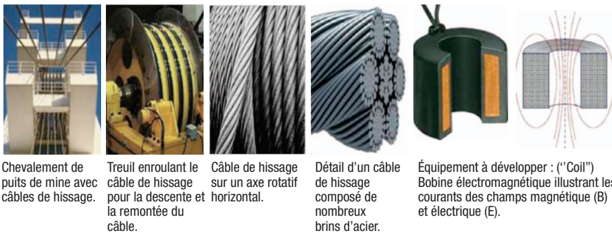
Chevalement de puits de mine avec câbles de hissage.